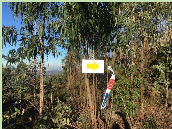
Setas amarelo refletor (primeiros 10km)