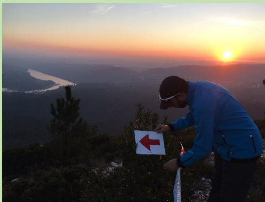
Setas vermelhas (a partir do km10)