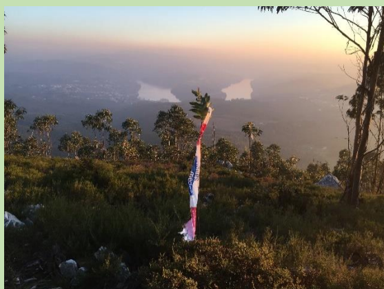
Fitas balizadoras com logotipos Melres Medas e ABA